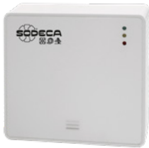
SI-PM2,5+VOC SI-CO 2 +VOC

Älykäs ohjain EC-puhaltimien automaattiseen tai manuaaliseen ohjaukseen.