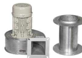
Sur demande : bride support ventilateur