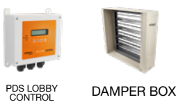
PDS LOBBY CONTROL